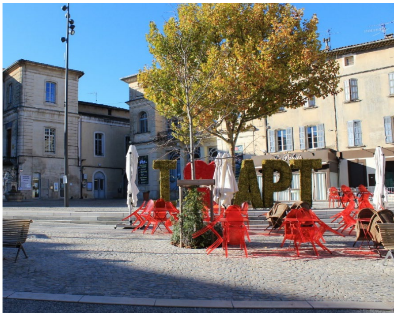
Place Gabriel Péri