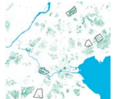
Carte cumulée des potentialités d'oasis urbaines