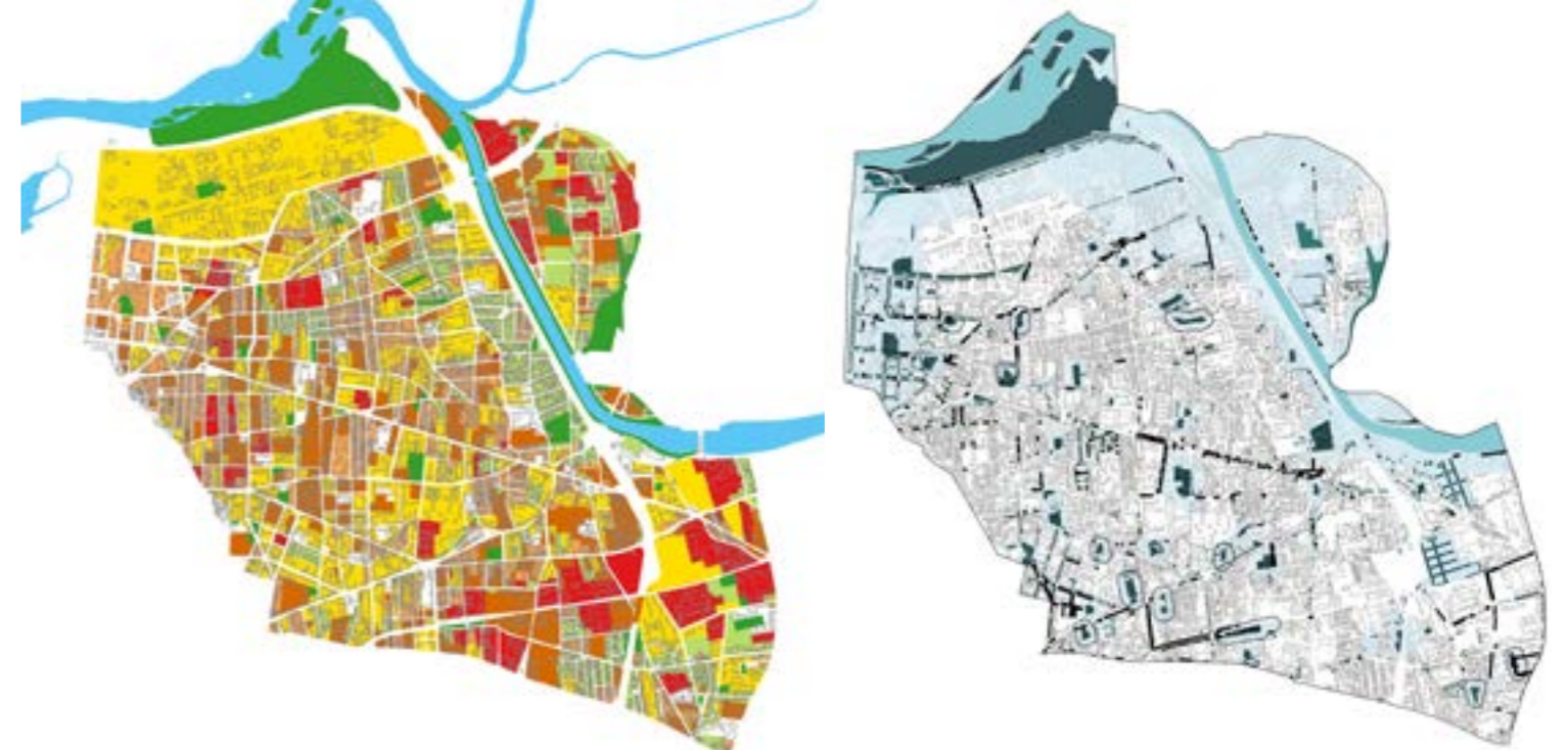
Le coefficient de surchauffe urbaine des tissus villeurbannais