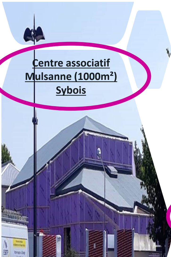
Centre associatif Mulsanne (1000m 2 ) Sybois