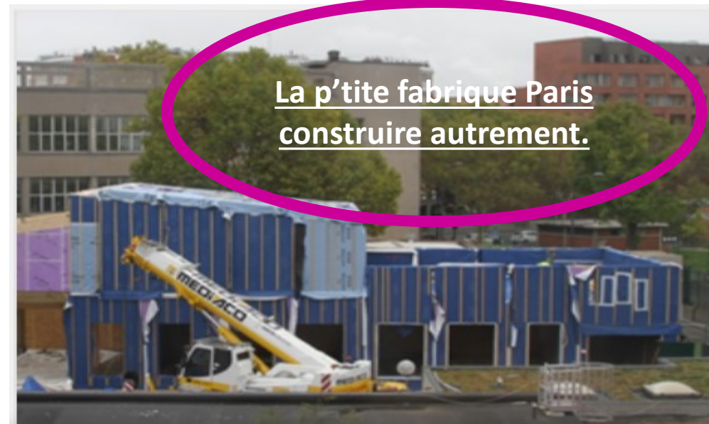
La p'tite fabrique Paris construire autrement.