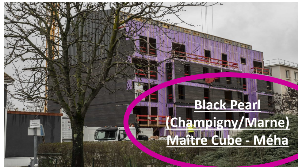
Black Pearl (Champigny/Marne) Maître Cube - Méha