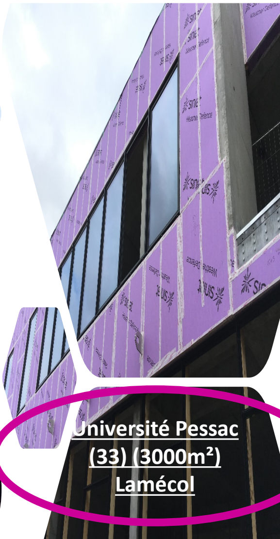
Université Pessac (33) (3000m 2 ) Lamécol