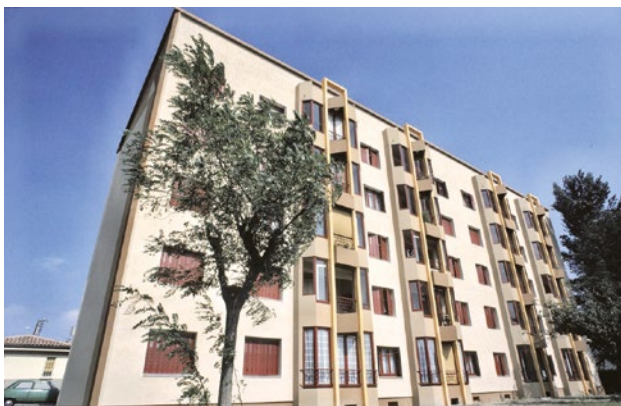
La France compte 33 millions de logements : 18,6 millions de maisons individuelles et 14,4 millions d'appartements en logements collectifs.

Les trois quarts des logements en copropriété ont été construits après 1949, et de nombreux l'ont été, alors qu'il n'existait pas encore de réglementation thermique. Ils ne bénéficient donc pas d'une isolation performante et d'équipements énergétiques efficaces. Il est important d'y effectuer des travaux pour limiter leur consommation d'énergie , d'autant que le coût de celle-ci va augmenter dans les années à venir : anticiper ce mouvement est indispensable.