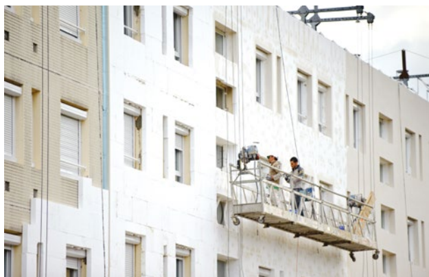
Le ravalement de façade est souvent un moment propice pour entreprendre également une isolation par l'extérieur.