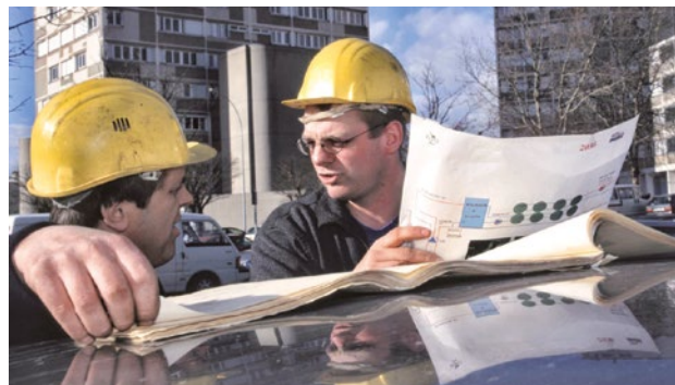
Le conseil syndical doit être tenu informé de l'avancement des travaux.

Le conseil syndical , qui représente l'ensemble des copropriétaires, reste l' interlocuteur privilégié du Syndic et des professionnels . Il prend part aux réunions avant et pendant les travaux et assiste à la livraison. C'est le conseil syndical qui informera l'ensemble des copropriétaires.