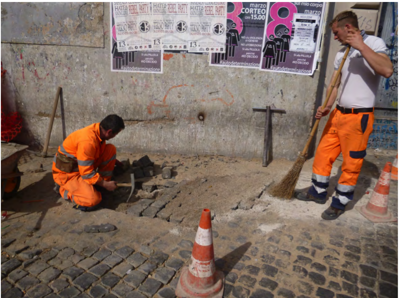
A Rome, la pose au sable des pavés de roche volcanique noire extraite des carrières des colli Albani, à proximité de la ville, procure une perméabilité des sols présentant bien des avantages : une nappe nourrie qui permet une meilleure croissance des végétaux, une évaporation des plantes comme du revêtement qui contribue au rafraîchissement de la ville, à la limitation des crues à l'aval, à la facilité d'intervention sur les réseaux, etc.