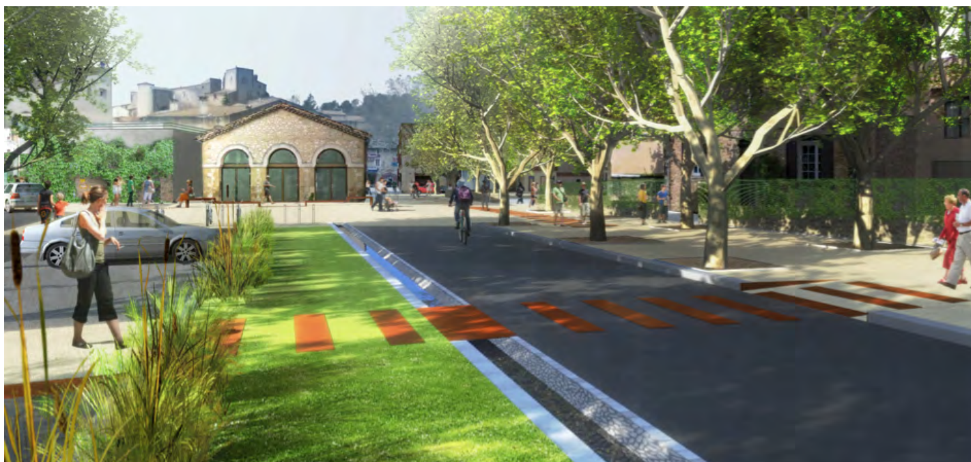
Vedène (84), aménagement de la place du marché/ fils d'eau, bandes enherbées perméables, ombrage d'arbres de hautes tiges. Un nouveau paysage urbain pour un meilleur confort thermique d'été. Conception : agence Paysages, Avignon

améliorations sont possibles comme par exemple le fait d'éviter d'installer de nouveaux éclairages et de conserver la « trame noire » des espaces non encore équipés, ou en réduisant la sur-illumination (la commune de Lille a récemment atteint 35% d'économie sur son budget d'éclairage public) ou encore en limitant la durée de l'éclairage (l'extinction totale à partir de 1 heure du matin a été appliquée dans de nombreuses communes) et en faisant appliquer l'arrêté du 1er juillet 2013 interdisant l'éclairage des bureaux, façades et commerces à partir de 1 heure du matin 20 . Il n'est pas très coûteux de changer les lampes ou de mettre en place des filtres adaptés pour en revenir à une composition spectrale de la lumière aux longueurs d'ondes plus chaudes, contrairement à la tendance développée depuis les années 80 dans le domaine de l'éclairage public qui a provoqué des ravages en termes de biodiversité nocturne. Un nouveau paysage nocturne de l'après-pétrole, propre au caractère de chaque ville reste donc à concevoir qui, en limitant grandement les consommations énergétiques (aujourd'hui 5,6 TWh, soit 1% de la production totale d'électricité) contribuera significativement à la lutte contre l'érosion de la biodiversité urbaine.