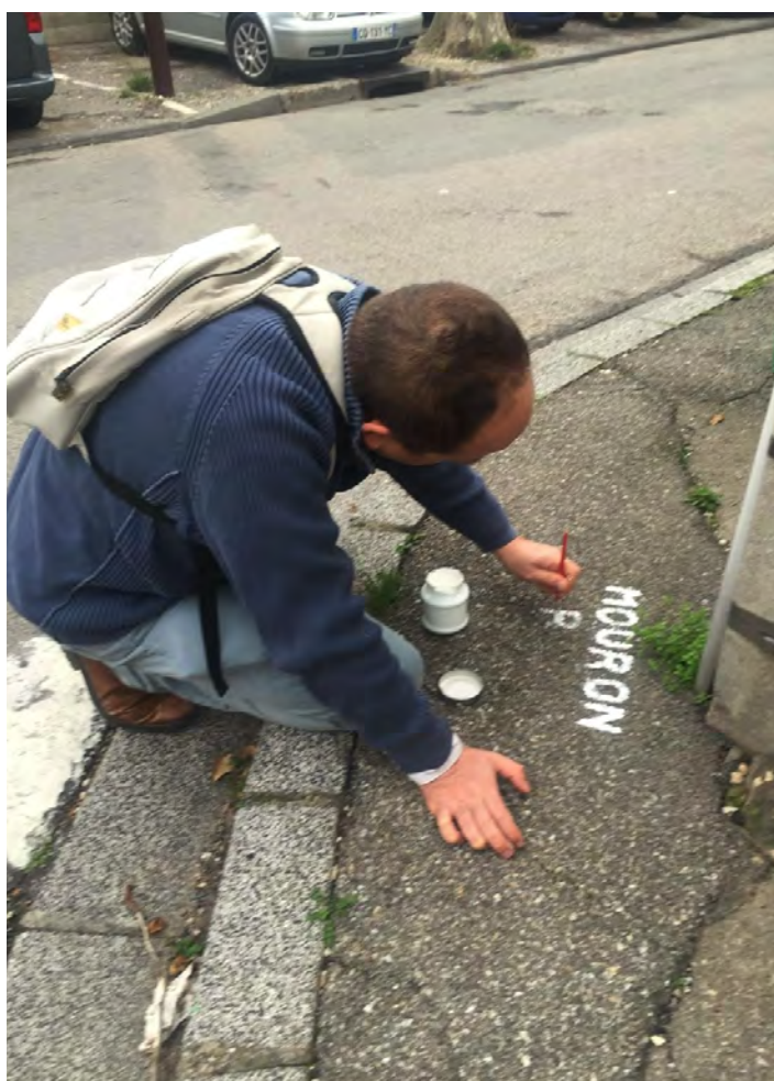
Avignon (84), ateliers de terrain de VOLUBILIS : par la promenade urbaine et la nomination, redonner de la valeur aux « mauvaises herbes » qui en acquièrent un nouveau statut.

importantes. La valeur 1 est celle d'un matériau qui réfléchirait, tel un miroir parfait, toutes ces longueurs d'onde. Les matériaux à fort albédo montent moins en température quand ils sont soumis au rayonnement solaire. Ainsi des matériaux à fort albédo, tels les revêtement en pierre (albédo de 0,45 pour de la pierre beige ou gris clair), en stabilisé clair (0,14) ou en platelage bois (0,35) accumuleront moins de chaleur dans les rues, les parcs et les places qu'un enrobé ou un asphalte à l'albédo faible (0,05). Il en est de même lors des choix des revêtements de façade, l'ensemble générant ces « effets canyon » et îlots de chaleur urbain plus ou moins marqués.