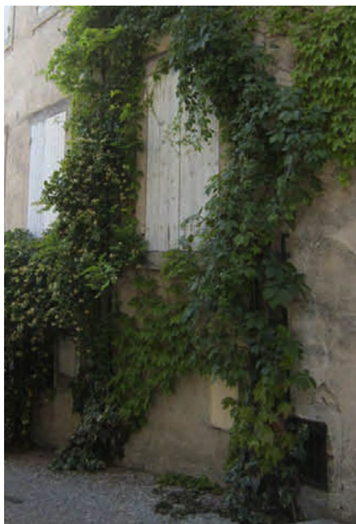
Donzère (26), plantation de plantes grimpantes en pied de façade.

une ville-centre particulièrement dense comme Paris et sa périphérie, la campagne et les forêts, était déjà assez significative pour se montrer parfaitement lisible lors de chaque phénomène neigeux. En région parisienne, ces différences de températures dépassent parfois les 10°C. Mais la question ne faisait pas alors débat sauf, dans les dernières décennies du 20 ème siècle, en lien avec la question des pollutions.