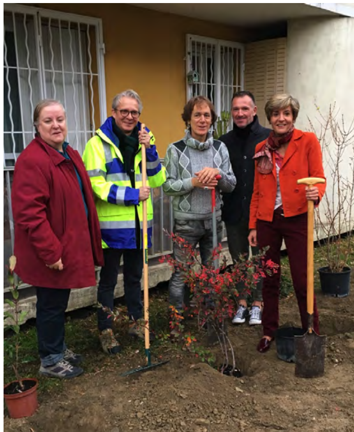
Plantations de pied de façade dans le cadre du programme de « végétalisation participative » de l'espace public. Avignon, madame le maire et les riverains inaugurent ce programme.