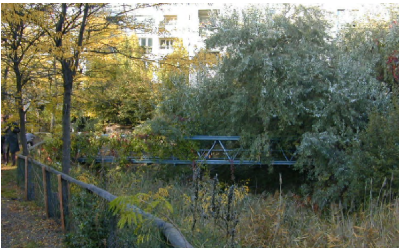
Berlin : la station de phyto épuration des eaux usées en cœur d'îlot urbain, la cour d'immeuble block 6 Bernburger strasse 22,23,26, Dessauer strasse 9-14. Architecte Loidl, Ingénieur Pr. Hahn.