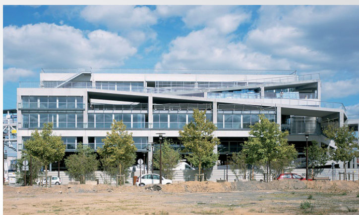
Tertiaire public ou privé, neuf ou rénovation... le système s'adapte au projet pour des gains réels et reproductibles.

Notre promesse : Mieux réguler votre chauffage.