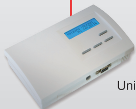
Unité centrale ZE