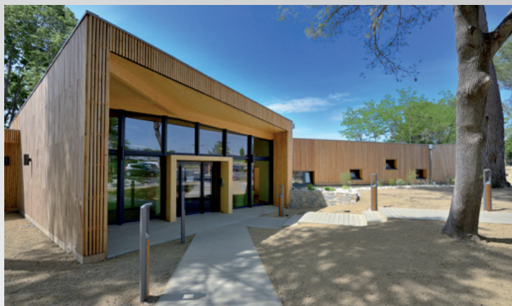
Crèche de Vaison-la-Romaine (84) labellisée BDM niveau Or régulée par ThermoZYKLUS avec gestion centralisée PCi.

Choisir ThermoZYKLUS, c'est l'assurance d'une qualité durable et d'un produit à forte valeur ajoutée dans une démarche de construction écologique, quels que soient l'émetteur et le projet.