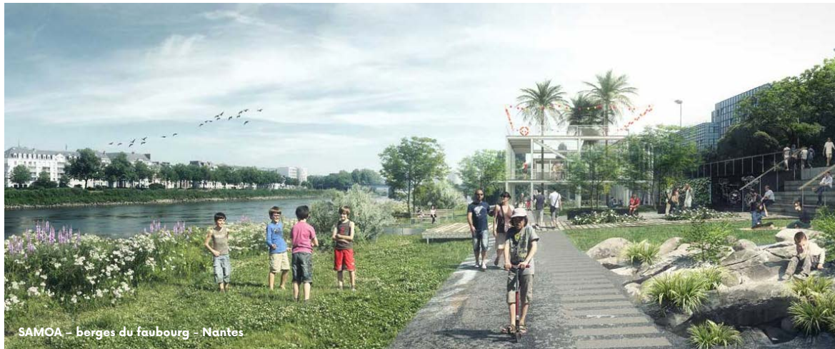
SAMOA - berges du faubourg - Nantes

R E A M É N A G E M E N T R E S T R U C T U R A T I O N R E S T R U C T U R A T I O N V A L O R I S A T I O N R E A P P R O P R I A T I O N