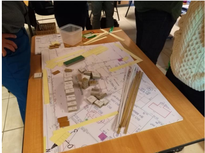
Atelier de conception participative sur maquette ETOILIE – avril 2017

Site du projet : https://etoilie.jimdo.com