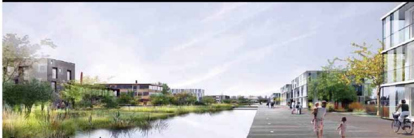
Eco-quartier du RAQUET à Douai : coupe de principe et vue perspective du bassin/canal.