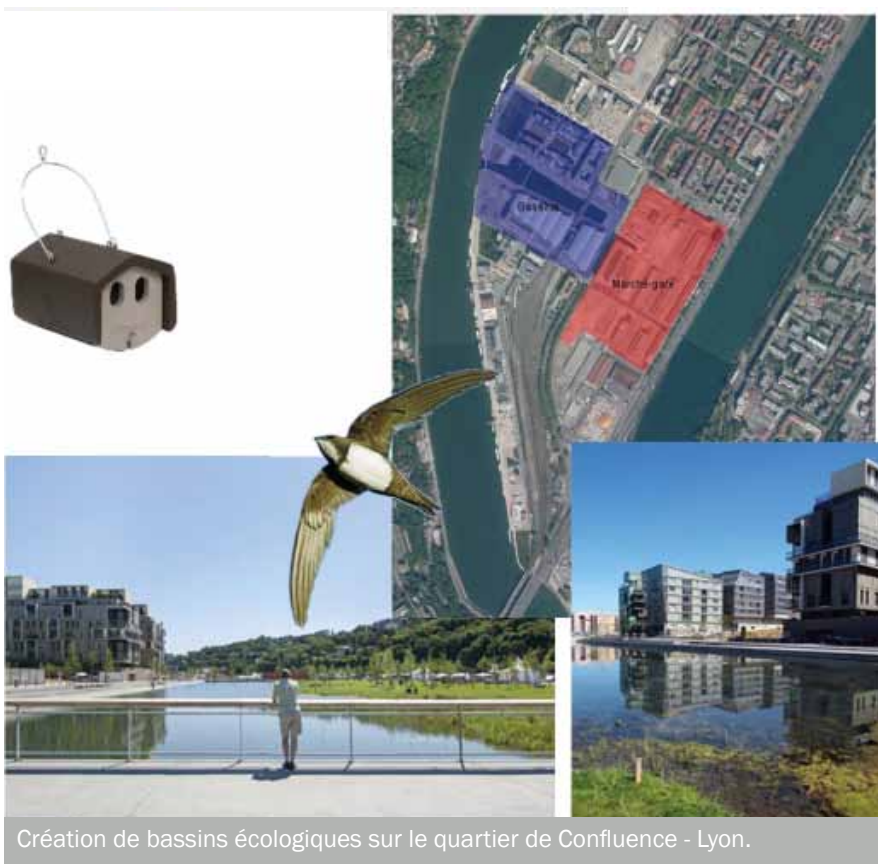
Création de bassins écologiques sur le quartier de Confluence - Lyon.

« Pour favoriser la biodiversité en ville, il est nécessaire d'améliorer le savoir-faire en conception et d'augmenter l'implication des usagers ».