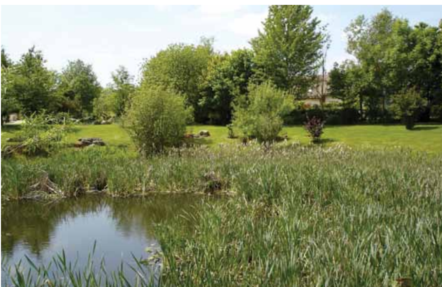
Conservation et valorisation d'une mare existante.

Certains contre-exemples de quartiers avec des gestions non-réussies sont dus à une mauvaise construction des réseaux et