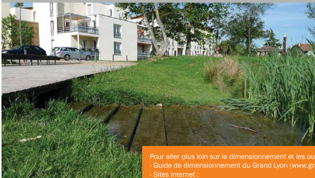
Belleville / Saint Jean d'Ardières : noue principale alimentant le grand bassin roselière.

Pour aller plus loin sur le dimensionnement et les ouvrages innovants : - Guide de dimensionnement du Grand Lyon ( www.grandlyon.com ) - Sites internet :