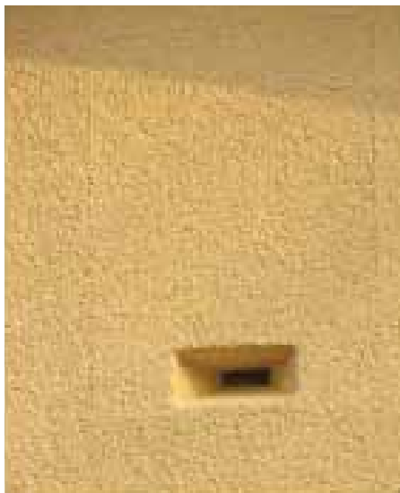
Aménagement d'un nichoir.