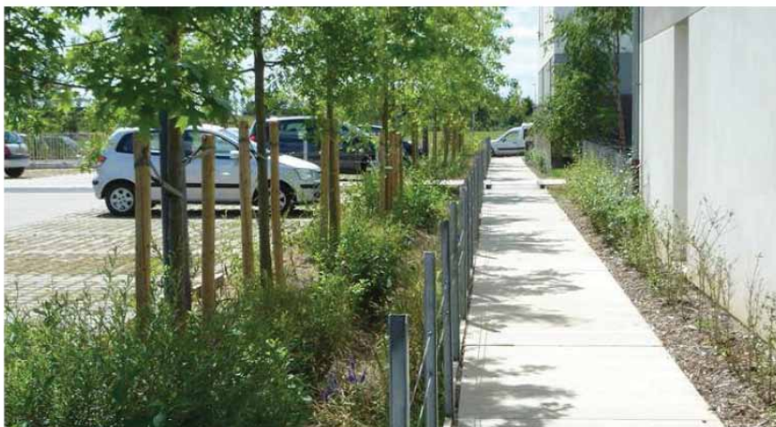
Villeneuve d'Ascq, le quartier de la Haute Borne - habitat individuel dense : parc de stationnement en revêtement poreux et noue le long du chemin et intermédiaires.