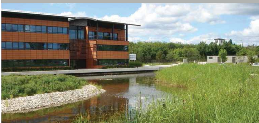
Ecully (69), aménagement d'un parc d'activités : bassin et lagune filtrante 4 mois après la plantation.