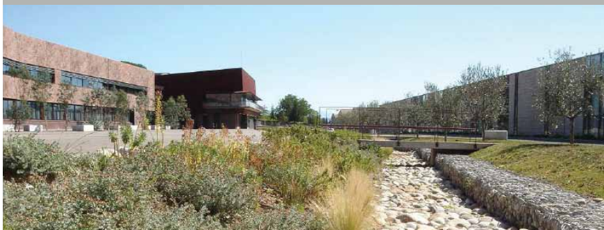
Manosque, 3 ème Lycée : rivière sèche collectant la pluie de la cour.