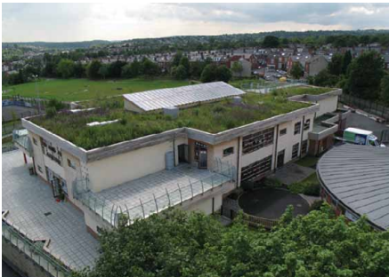
Toiture labellisée « biodiversité ».

La végétalisation des toitures, a minima semi-extensive, permet d'améliorer l'isolation du bâti et sa pérennité.