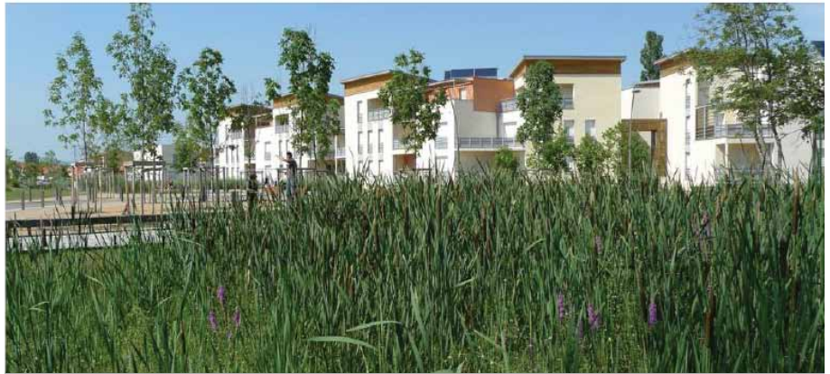
Le quartier des Villards à Belleville / Saint Jean d'Ardières : la roselière comme centre du parc urbain de ce quartier d'habitations.

Le premier principe d'une gestion alternative des eaux pluviales réussie est de reconstituer hors sol le réseau hydrographique naturel souterrain. Il est indispensable d'appréhender le site au regard de son bassin versant qui