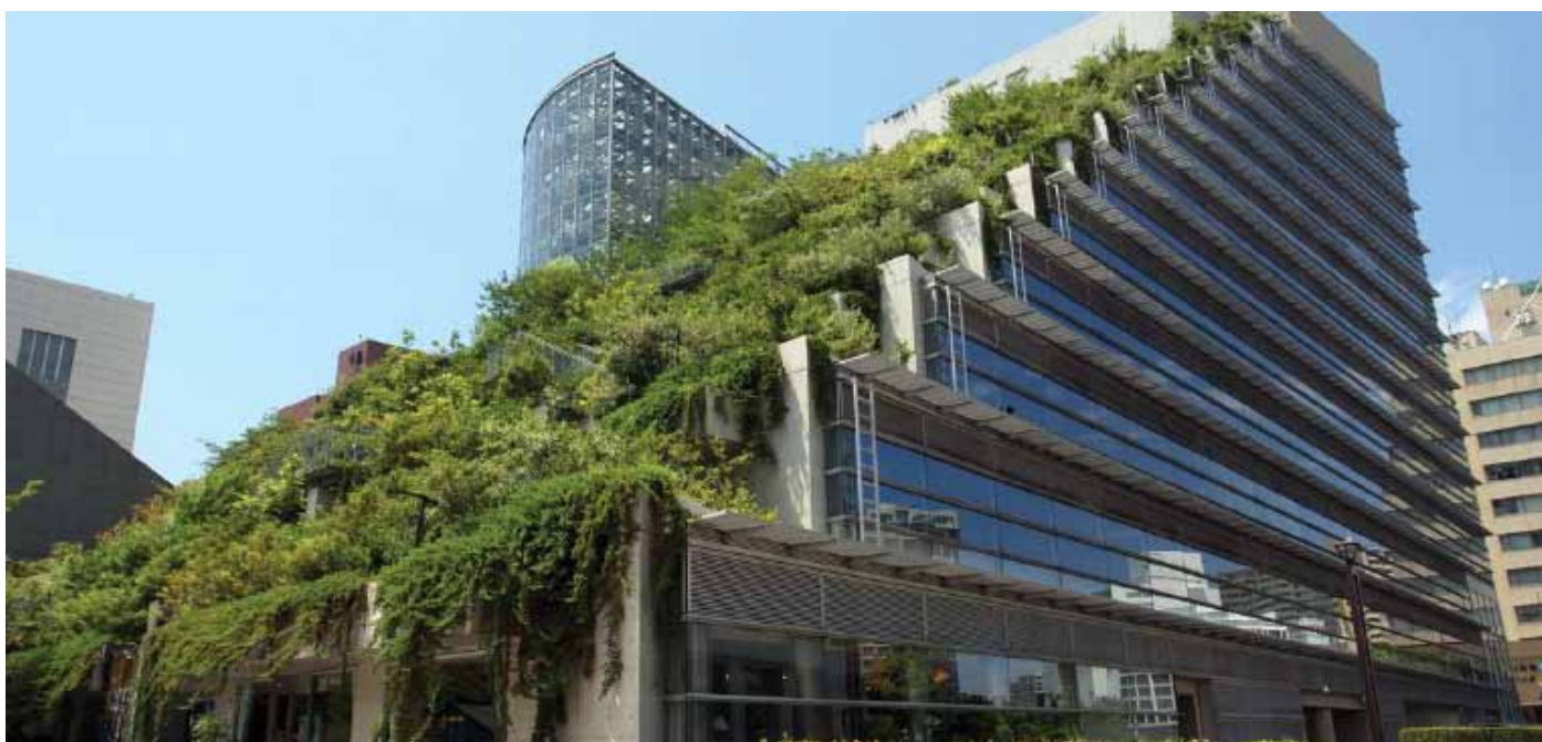
Toiture végétalisée intensive en terrasse.

Pour l'éclairage de nuit, privilégier de sources tendant vers la couleur orange (éviter les UV).