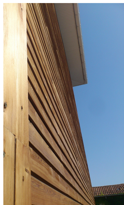
6 Zoom sur le bardage (façade Ouest)