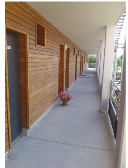
1 Teinte du bardage préservée