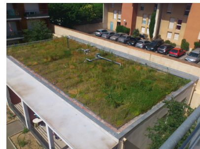
3 Toiture végétalisée après 4 ans