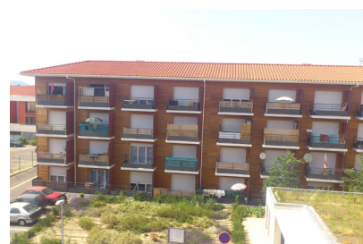
5 Volets fermés pendant la journée (été)