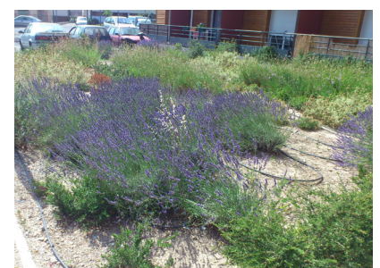
2 Essences de garrigue adaptées au climat méditerranéen