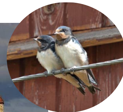
Hirondelles rustiques – Jean Deschâtres