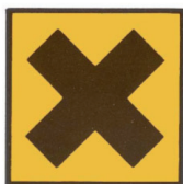
Xn - NOCIF