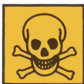
T+ - TRÈS TOXIQUE