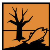
DANGEREUX POUR L'ENVIRONNEMENT