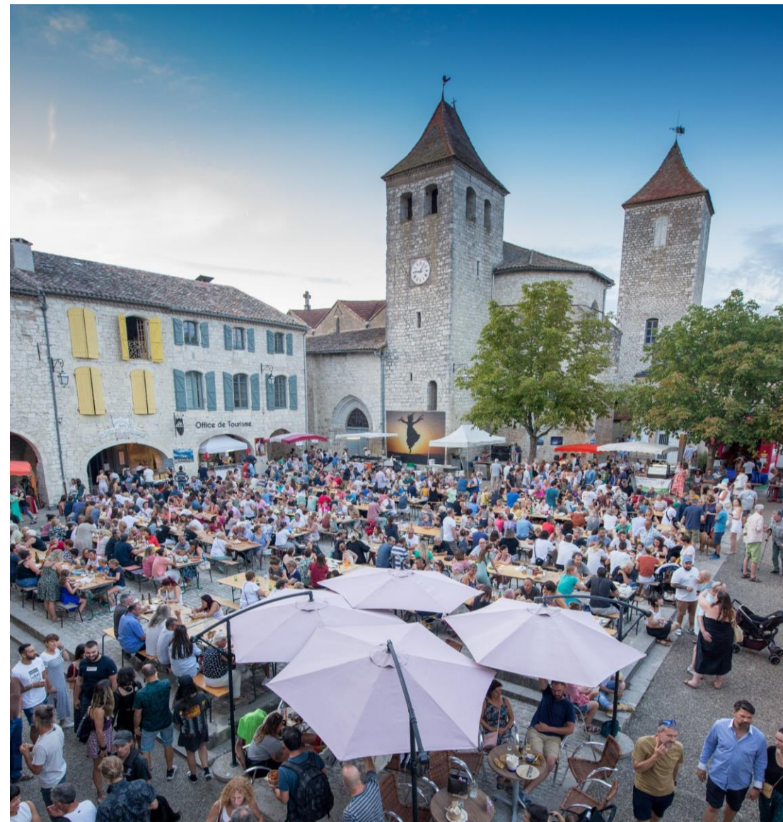
Collecte pour le retable de la Vierge, église Saint-Barthélémy de Lauzerte (Tarn-et-Garonne) © Kar