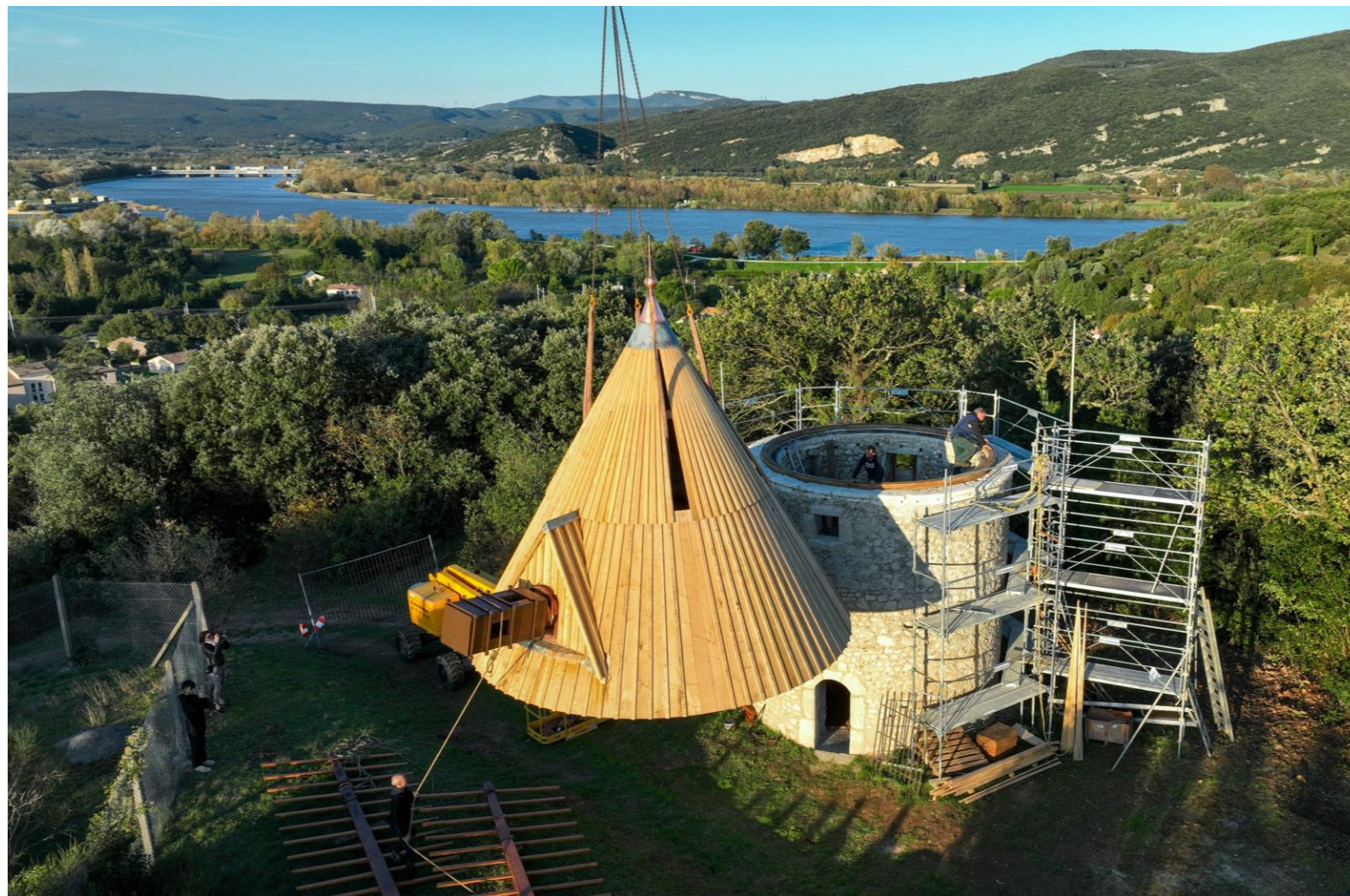
Moulin de Beauvère à Donzère (Drôme)