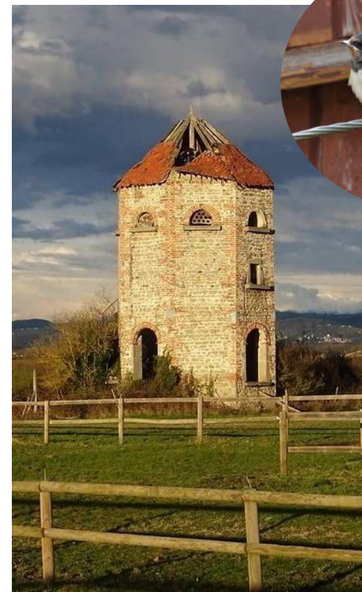
Hirondelles rustiques – Jean Deschâtres