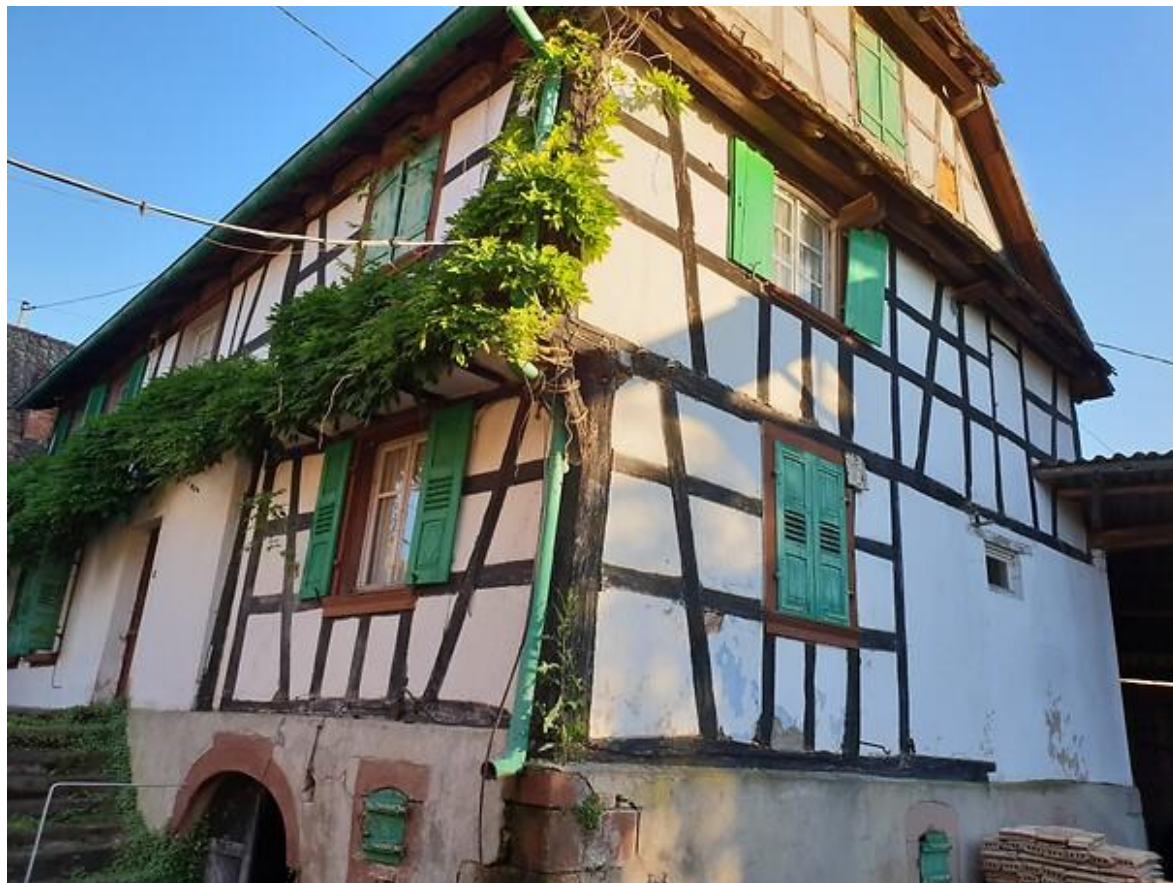
Ferme d'Engwiller (Bas-Rhin)