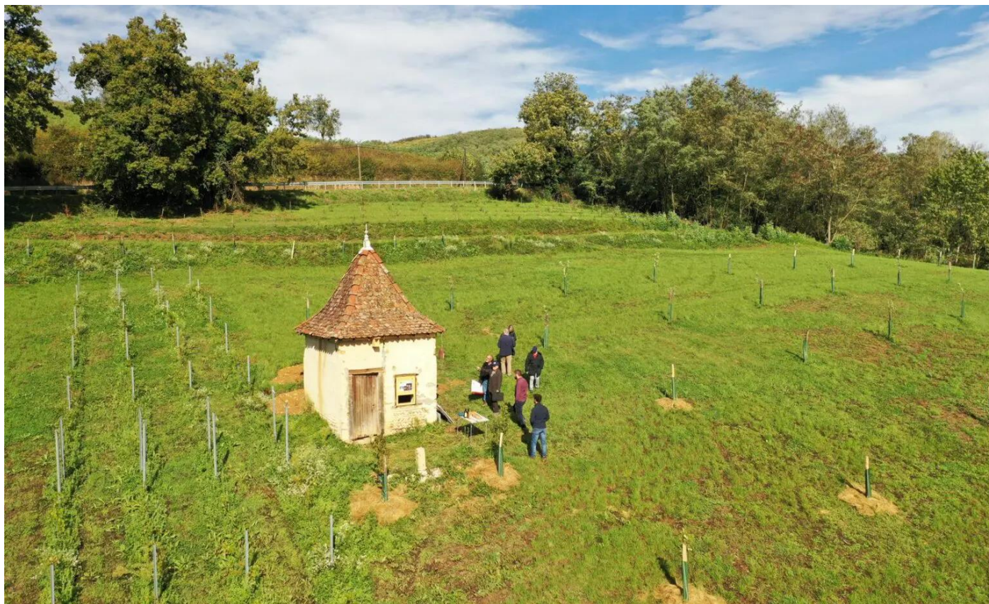
Cabane de vigne restaurée à la Côte St André (Isère)