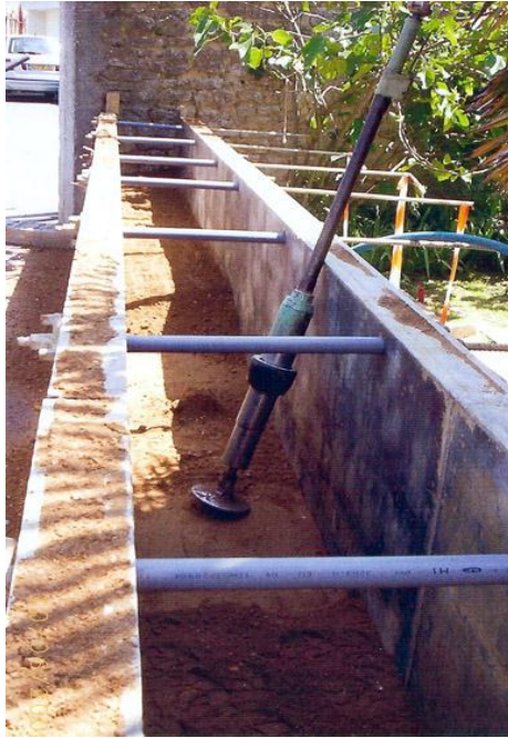
Elévation du mur en pisé dans des banches à béton à l'aide d'un fouloir pneumatique