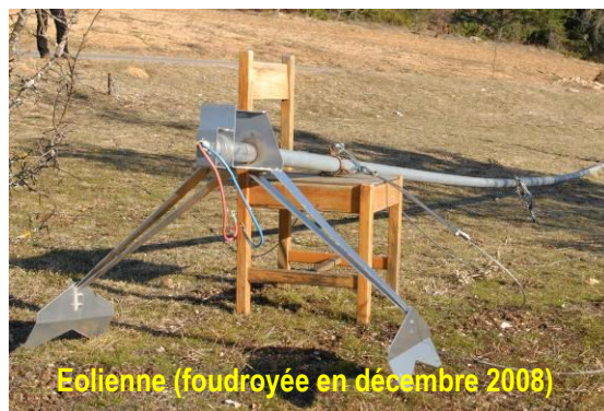
Eolienne (foudroyée en décembre 2008)

Les éoliennes les plus courantes, à axe horizontal, fonctionnent mal dans les zones urbaines où les turbulences sont importantes. Elles conviennent en revanche dans les secteurs ruraux, en particulier dans les sites isolés, si les vents sont constants et réguliers. La force, la fréquence et la régularité des vents sont des facteurs essentiels pour que l'exploitation de la ressource éolienne soit intéressante, et cela quelque soit la taille de l'éolienne. À moins de 20 km/h de moyenne annuelle (soit 5.5 m/sec) l'installation d'une éolienne domestique n'est pas conseillée. La production dépend de la vitesse du vent, du rendement du rotor et de la surface balayée par les pâles. Ce sont des machines de petite ou moyenne puissance (0,1 à 20 kW) montées sur des mâts de 10 à 3 m. Sur ce site, l'éolienne a deux pâles et produit 900W dans de bonnes conditions de vent... malheureusement trop rares : le propriétaire a choisit de ne pas procéder à sa réinstallation.