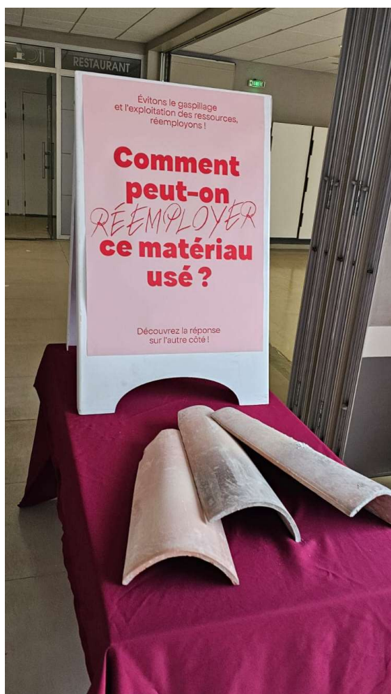
Vue de devant du stand (ici pour les tuiles)