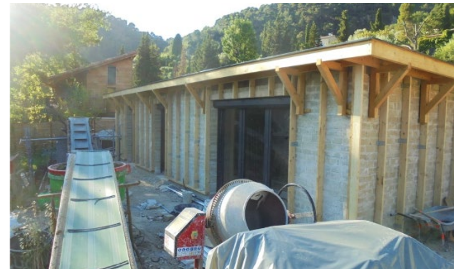
6. Maison achevée