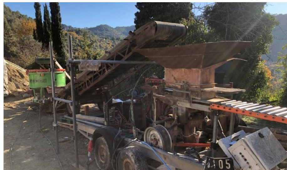
3. Compactage du mélange