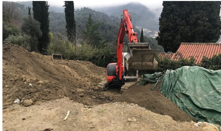
1. Criblage in situ