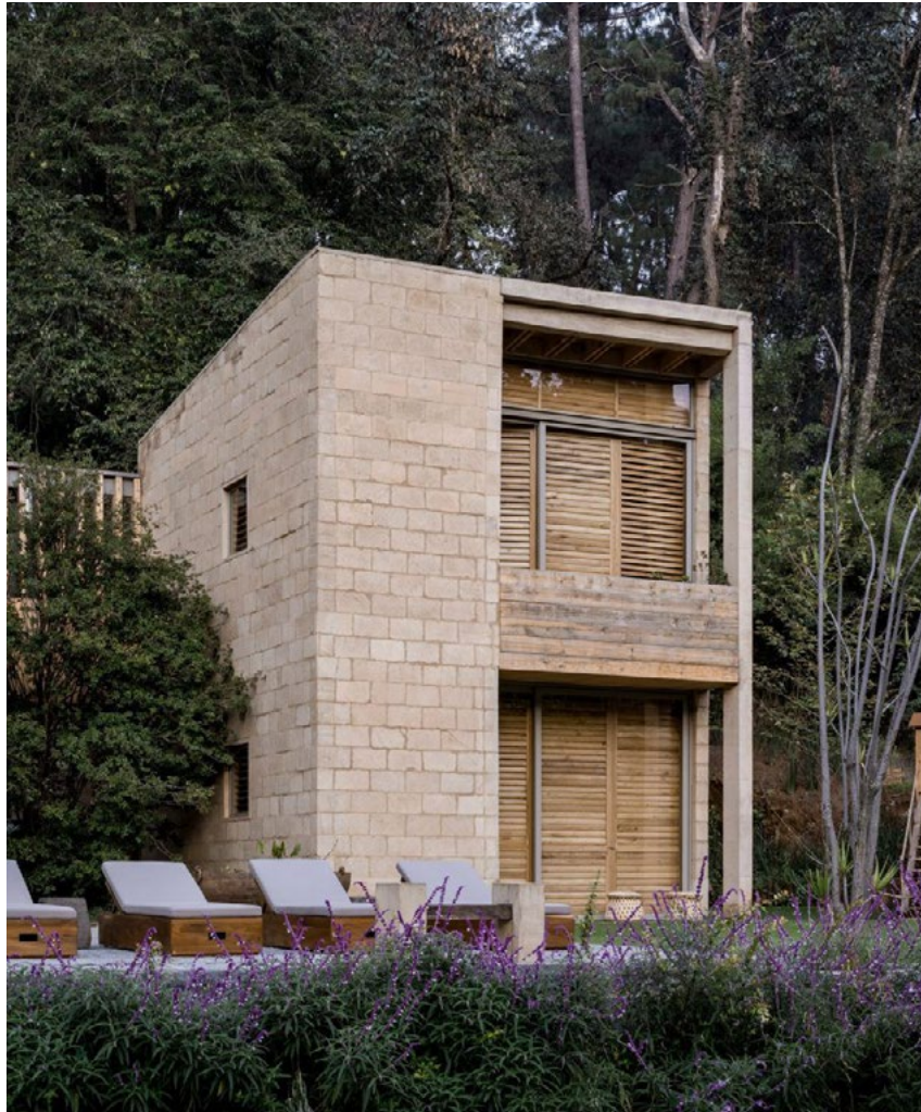
100% Fleur-de-Terre = intérieur + extérieur

Ses murs sont en briques compactées de terre crue, matériau régulateur d'hygrométrie, à changement de phase humide-sèche (jour/nuit, été/hiver), variations de température (jour/nuit, été/hiver) sans énergie.