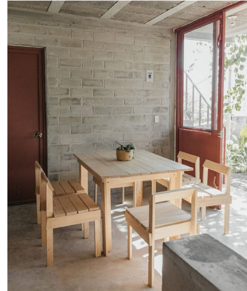
50% Fleur-de-Terre = murs intérieurs