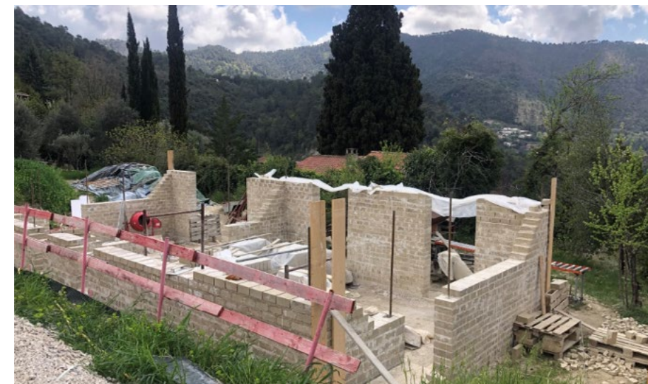
4. Construction des murs en BTC