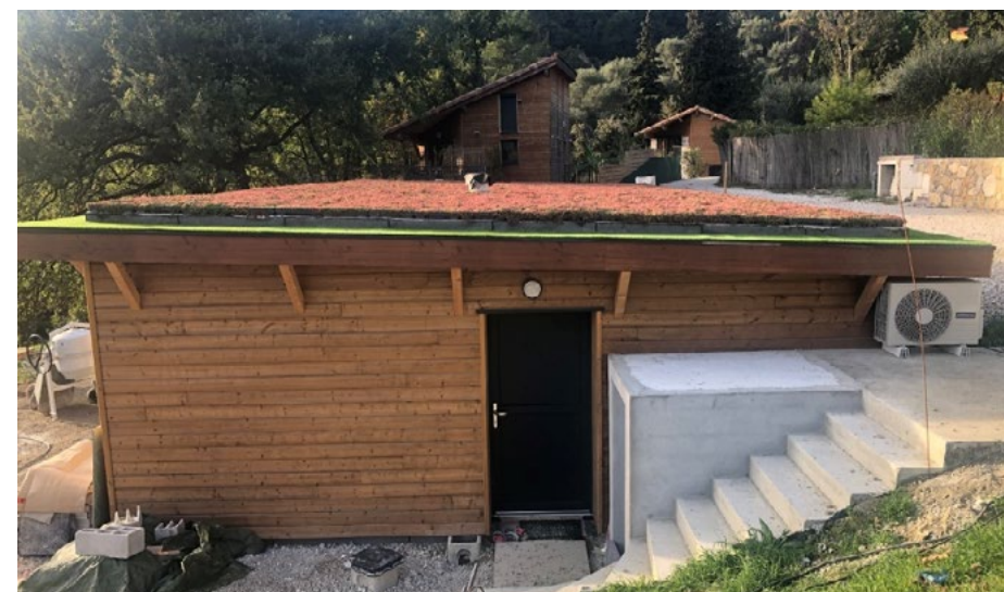
7. Maison finie avec bardage bois