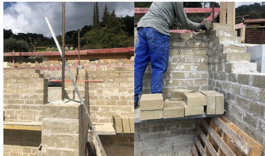
5. Mise en œuvre fers à béton et construction des murs