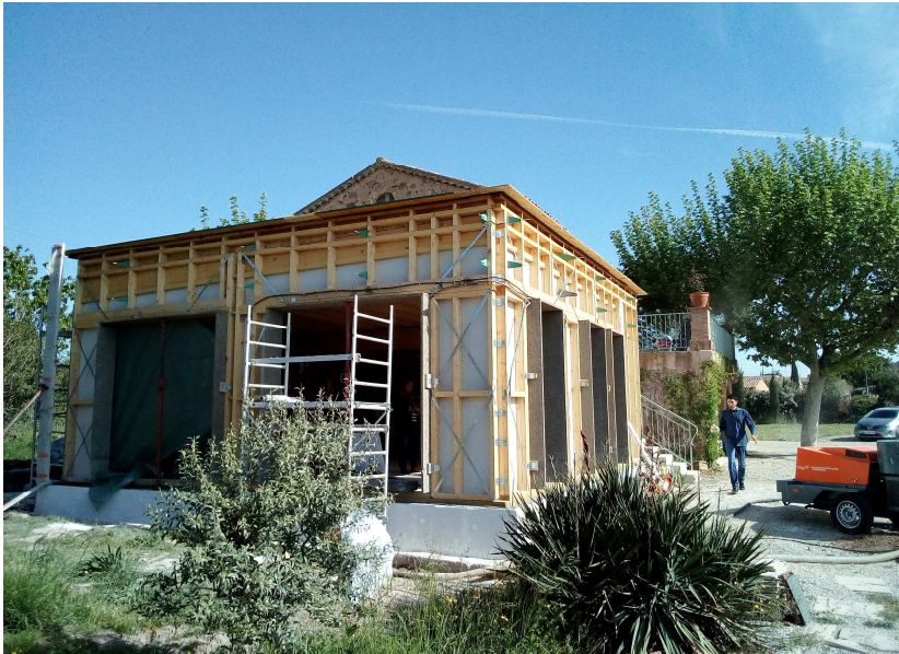
1. Vue d'ensemble de l'extension. Bastide en arrière-plan

Type d'opération : Réhabilitation + extension