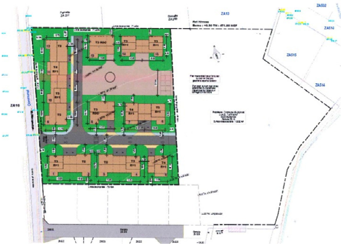
2. Plan masse du projet ©H+P

Dès l'esquisse, la programmation du projet prend en compte la volonté du groupe Habitations Haute Provence de réaliser des bâtiments sobres en énergie.