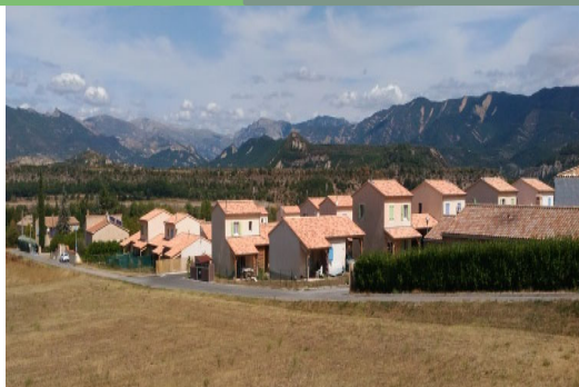
1. Vue sur la résidence « La Vicairie »