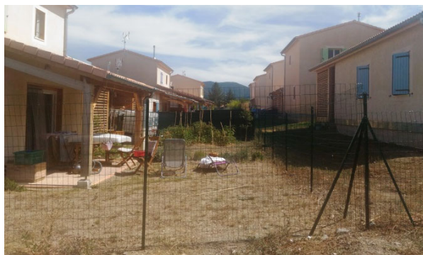
3. Jardins privatifs du projet.

Une attention particulière est apportée au traitement des limites de propriété. Les jardins privatifs sont délimités par des clôtures en grillage simple torsion plastifié vert. La voie de desserte, les stationnements et la desserte des abris véhicules sont en enrobé. La voie comprend une sur-largeur traitée en enrobé de couleur différente servant au cheminement piétonnier. Le reste de la parcelle est engazonné et des arbres à haute tige sont plantés le long des places de stationnement.