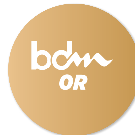
NIVEAU OR 80 points