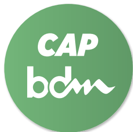
NIVEAU CAP 20 points