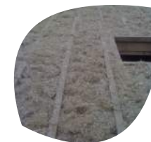
Béton de chanvre banché