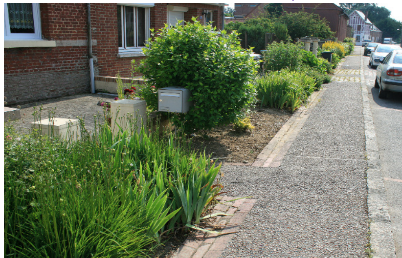
Au départ, dans cette rue, les constructions ne sont pas alignées -les plus en retrait se retrouvent cachées sur cette photo- et les limites privées ne sont pas toujours affirmées. Les plantations sur espaces publics permettent néanmoins d'organiser clairement l'espace et d'offrir un cheminement accompagné d'une bande accueillant diverses fonctions (boîtes aux lettres, encombrant, raccordement des seuils).

Les frontages peuvent ainsi participer de manière décisive à une meilleure lisibilité du statut de la voie, et à son fonctionnement en particulier dans les zones de rencontre. Historiquement, les premières formes de zones de rencontre sont justement nées dans des rues résidentielles, à travers une forte participation des riverains à l'aménagement et à la gestion de leur rue.