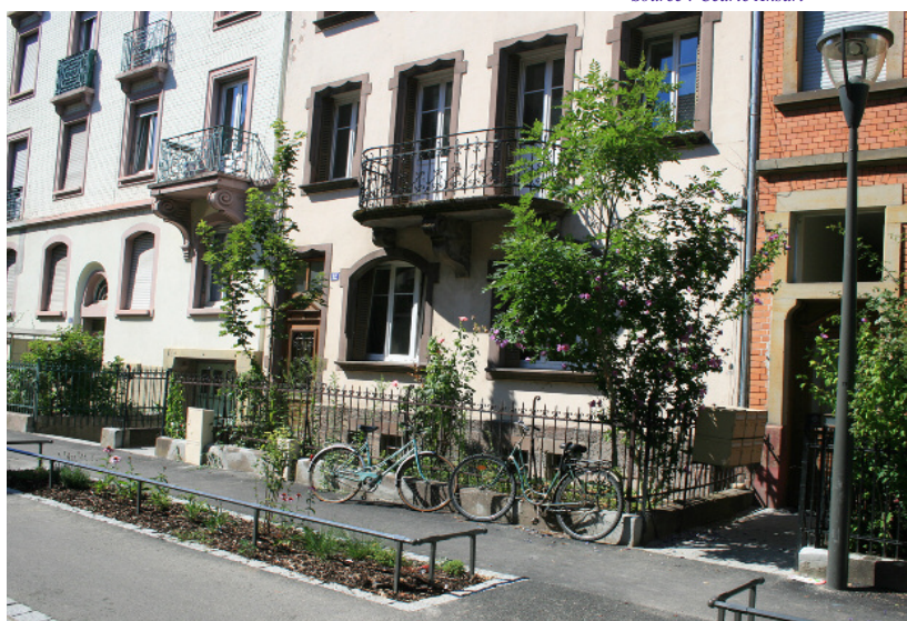
Dans ce quartier de faubourg, un frontage privé permet d'installer un seuil, des marches, des boîtes aux lettres, des plantations, et lorsque les immeubles disposent d'une cave, de créer un accès direct, une ventilation et un éclairage naturel à celle-ci.