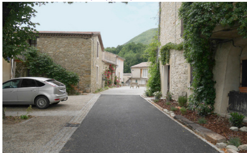
Dans cette rue en zone de rencontre, les riverains disposent de seuils et d'espaces de plantation en limite de propriété, si bien que la chaussée ne s'étend pas totalement de façade à façade et est un peu plus resserrée.

Nicolas Soulier / Concepteur équipe municipale de Vesc, b.e.t. T. Baudet, Mme C. Berne