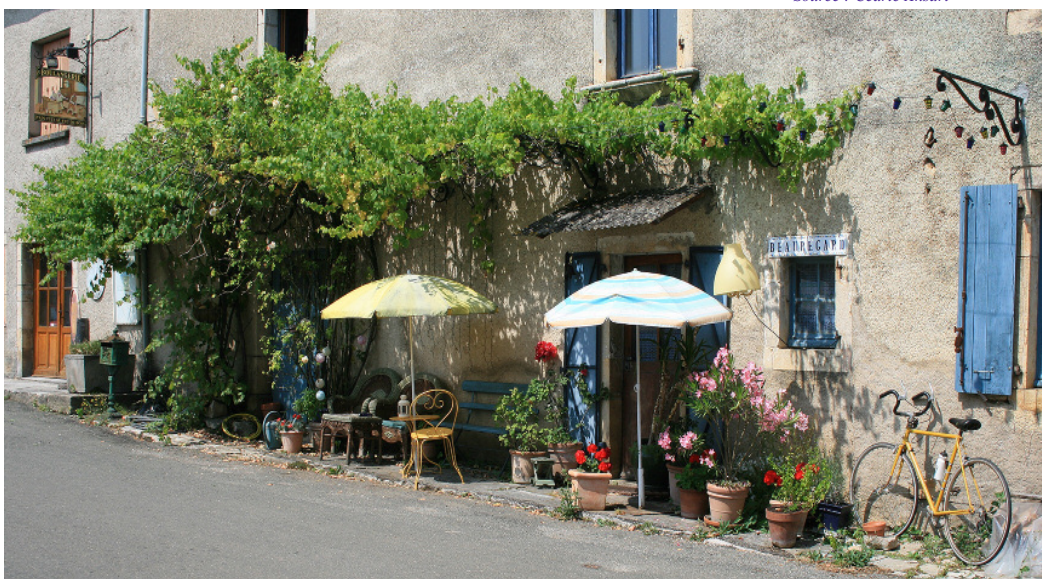
L'occupation riveraine témoigne du caractère habité des lieux et offre des signes de vie locale forts. Même s'ils ne sont pas physiquement présents, cette occupation évoque une présence possible de riverains, de passants ou de piétons éventuels.