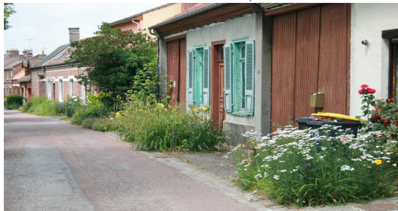
Dans cette rue réaménagée, le projet a pris soin d'offrir une bande en pied de façade. Celle-ci est au départ gérée par la commune mais chaque riverain est invité à prendre le relais, à planter, à gérer et à prendre soin de cet espace.

Concepteurs : A Ciel ouvert - DDE80