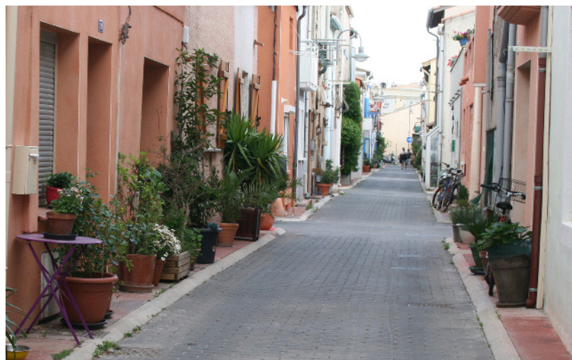
Au départ, les pieds de façade étaient trop étroits et peu praticables -marches, débord-pour que le piéton y chemine confortablement et celui-ci se positionnait spontanément à distance des façades. Chaque riverain a investi cet espace étroit de manière réversible, confortant le fonctionnement intuitif de la rue et les pratiques du piéton.