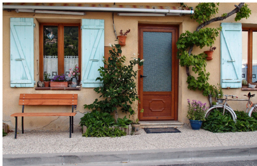
Dans ce village, les riverains occupent directement le pied de façade: banc, plantations, seuils sont installés sur le trottoir plutôt que dans un espace privé séparé. Dans ce cas, chacun doit être sensible au fait de permettre un cheminement piéton dans de bonnes conditions et manifester une attention particulière aux personnes à mobilité réduite.

Concepteurs : A Ciel ouvert - DDE80