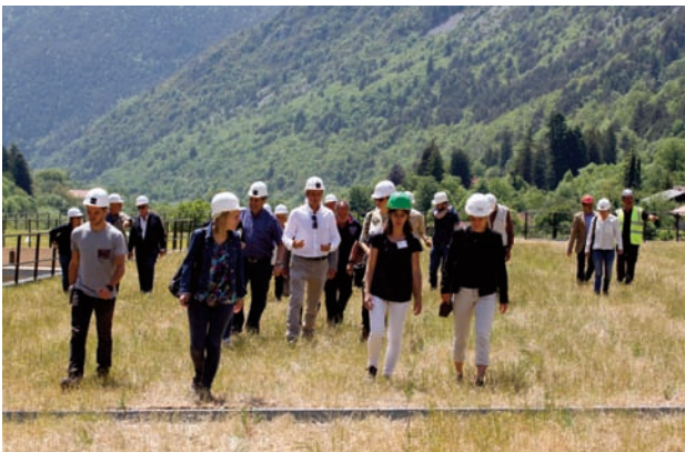
Doc. LE PRIEURÉ

Une visite de la toiture et une présentation du projet dans son ensemble a d'ailleurs été organisée le 27 mai dernier, auprès de prescripteurs de la région, en présence de tous les acteurs du projet : l'Agence Faragou bien sûr, mais aussi le Cabinet d'architecte Chabanne & Partenaires, l'entreprise générale Léon Grosse, l'entreprise d'étanchéité Projisol et la mairie de Saint-Martin-Vésubie.