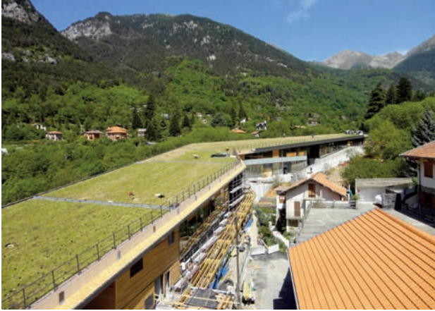
Doc. LE PRIEURÉ

Réalisé par l'Agence Faragou, le relevé floristique des pâturages locaux a permis de définir la palette végétale idéale afin que le pôle sportif s'intègre parfaitement dans la vallée tandis que LE PRIEURÉ a fait valoir ses 20 ans d'expérience en végétalisation du bâti pour la sélection définitive des plantes propres à une culture sur toiture ainsi que pour leur technique de mise en œuvre.