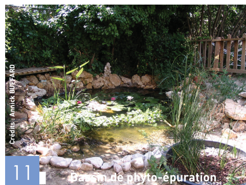
Bassin de phyto-épuration