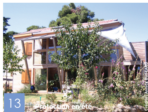
Protection en été